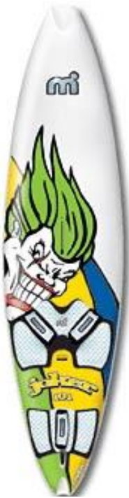
Mistral Joker 113 L 249cm, B 68cm, V 113 L,