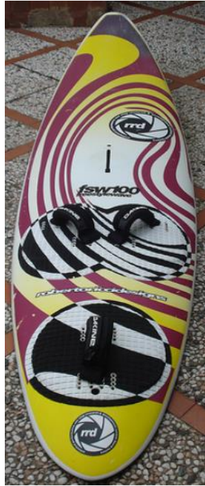
RRD FREESTYLE WAVE 100 L 256cm B 62cm, V 99 L,