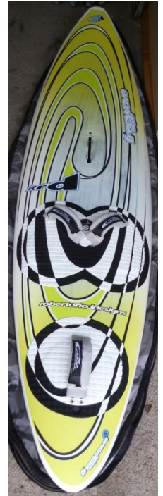
RRD FREESTYLE WAVE S L 245cm, B 55cm, V 77 L,